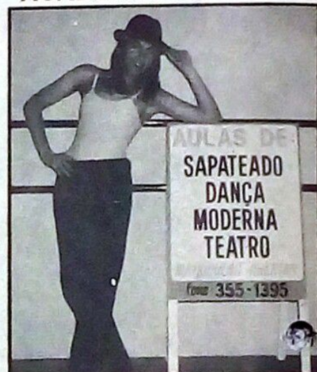
Cursos de sapateado, dança moderna e teatro, com 10% de descontos na matrícula e mensalidades.