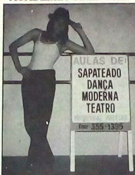
Cursos de sapateado, dança moderna e teatro, com 10% de descontos na matrícula e mensalidades.

crianças), descontadas em folha de pagamento.